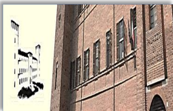
Camera Civile del Foro di Vercelli