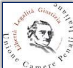
Camera Penale di Vercelli

L'AVVOCATURA CASALESE Associazione culturale forense Casale Monferrato